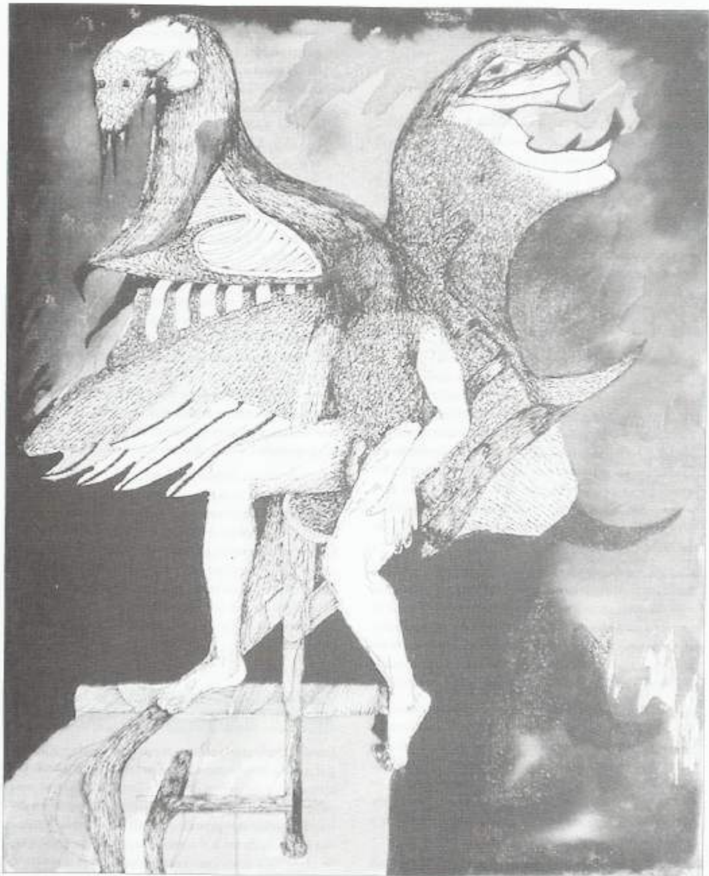
Fernando Melián Sin título Tinta china sobre papel