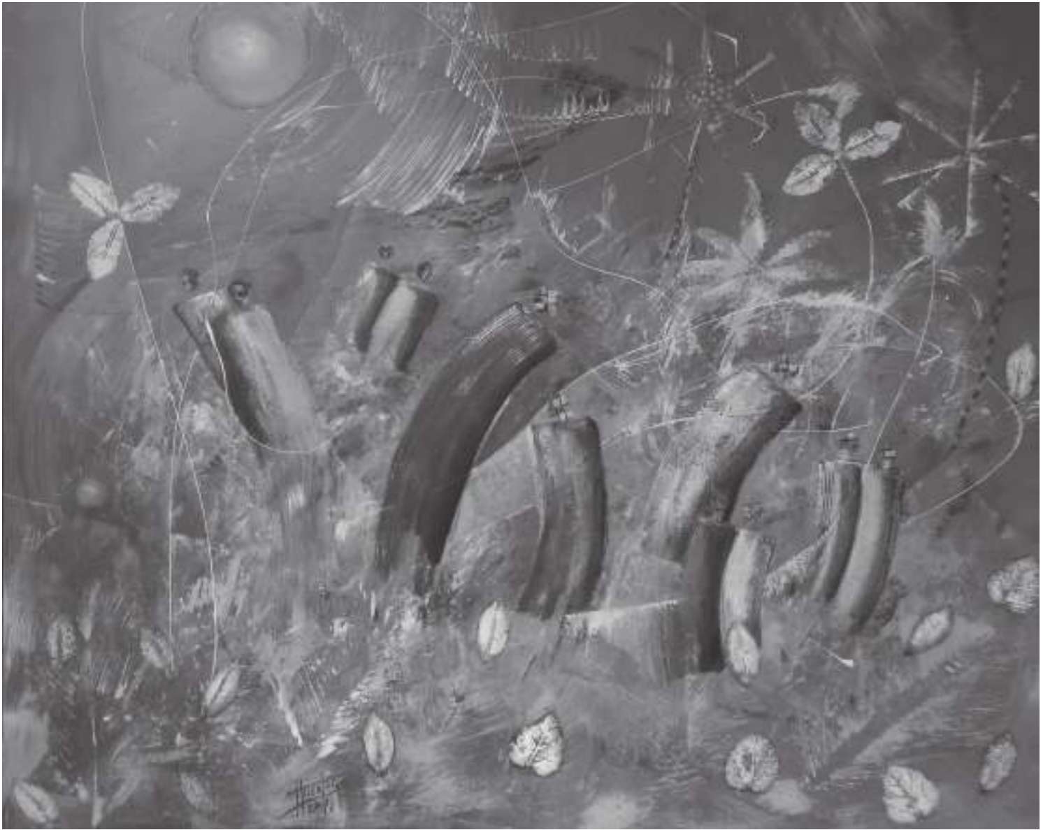
Segundo Aristides Huertas Torres » Título: de la serie caminantes » Técnica: Óleo sobre tela » Dimensiones: 140 cm x 140 cm